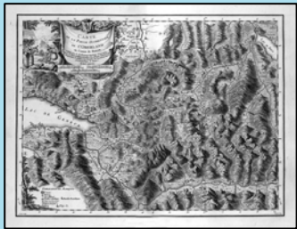
Beauvais, Carte de l'Oberland

Viaticalpes : Zugang zu einem aussergewöhnlichen Kulturgut über die Datenbank RIVES